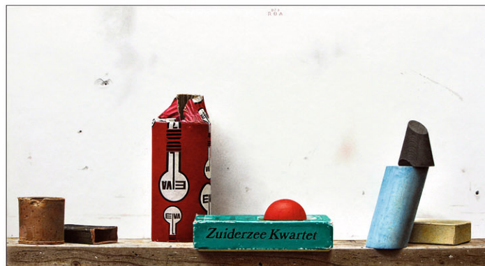
"Elva II" 2023 kleurpotlood/karton 5 x 46 cm