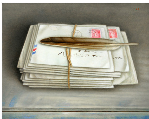
"Voorbije Liefde VII" Past Love I 2022, olie/paneel, 24 x 30 cm