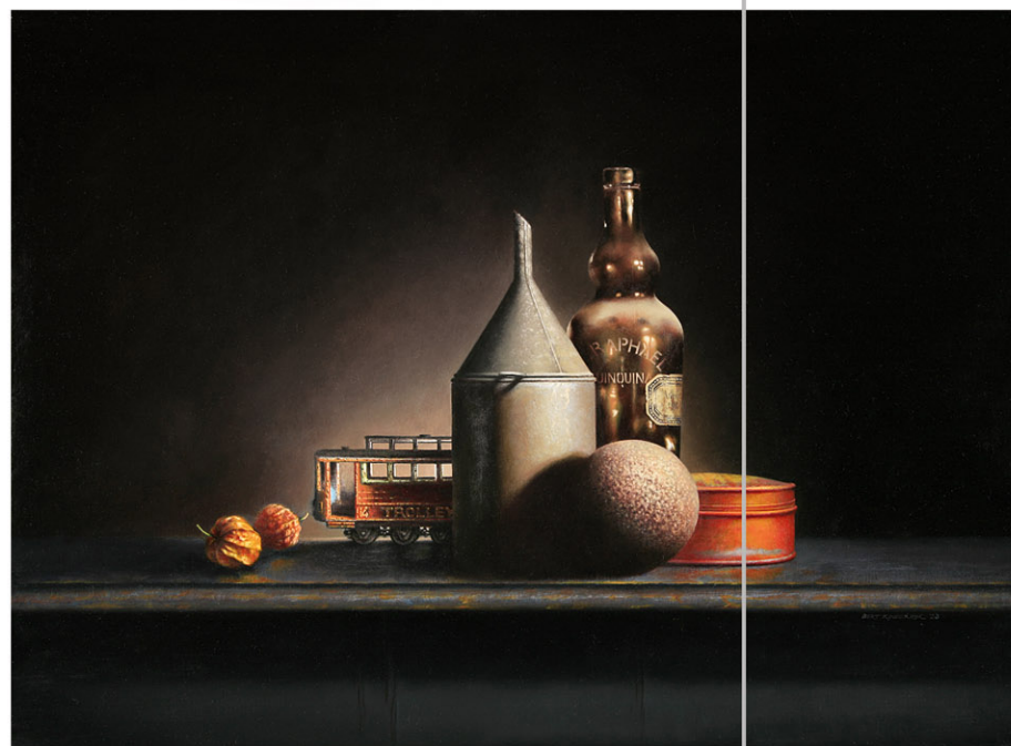
"Lijn 14" 2023 olieverf/doek 60 x 80 cm