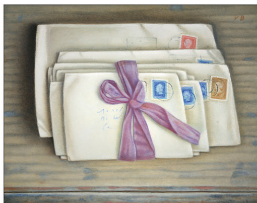
"Voorbije Liefde VII" Past Love I 2022, olie/paneel, 24 x 30 cm