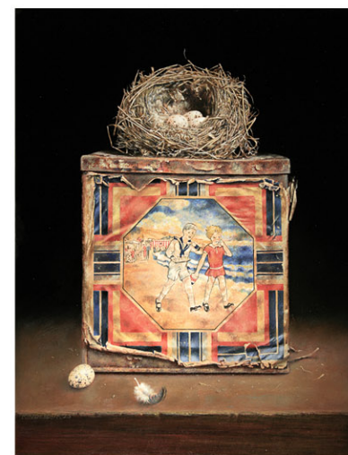
"Een Mooie Dag" 2023 olieverf/paneel 40 x 30 cm