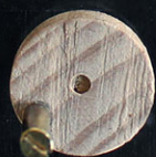
Johan Scherft "Automaton - 999 Animals" 2020 inkt/papier, mechaniek, in vitrine 20 x 10 x 20h cm