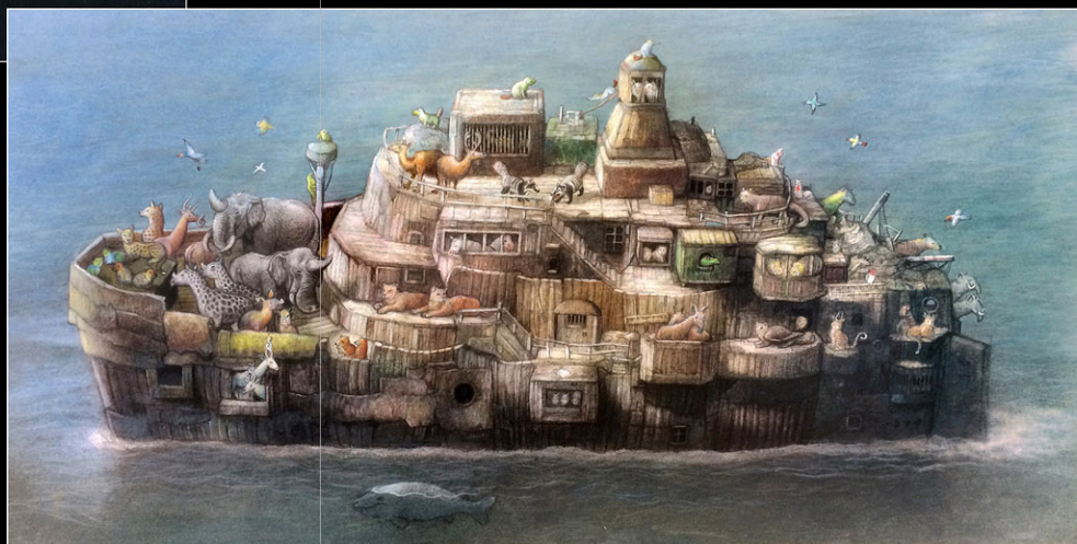
Johan Scherft "The Lost Ark" 2022 olieverf/paneel, 29,8 x 57,3 cm

ingewikkelde automatonen, waarvan de kroon spant een minuscule carroussel van drie rollen tekeningen, die al draaiend een duizendtal verschillende combinaties van kop, lijf en staart te zien geven, u raadt het vermoedelijk al, van tal van prehistorische dieren. Omdat het draaimechanisme met de hand wordt bediend en men zodoende dagen bezig is om alle combinaties te zien, slaat pas dan het duizelingwekkende inzicht in de complexiteit van de schepping in volle kracht toe. U raadt het vast, dit is een ge-laagde zin. Met de geaquarelleerde vogeltjes, gemaakt van een blaadje papier, is iets dergelijks aan de hand, maar dat bewaar ik voor de volgende keer.