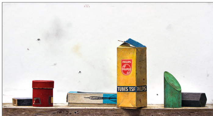
"Philips" 2023 kleurpotlood/karton 25 x 46 cm

In het werk van mediterrane schilders meen ik doorgaans hun landsaard te kunnen herkennen. Of dat nou klopt of niet, is toegestaan of niet, ook dat, maar van Roa kan ik het niet. Maar eerst een stukje voorgeschiedenis. Ooit maakte ik een reis door Spanje met het oogmerk de nationale talenten aangaande het realisme te ontdekken en van hun werk een tentoonstelling te maken. In mijn ogen een van de allerbesten, genaamd Gustavo Isoe, bleek uit Japan te komen.