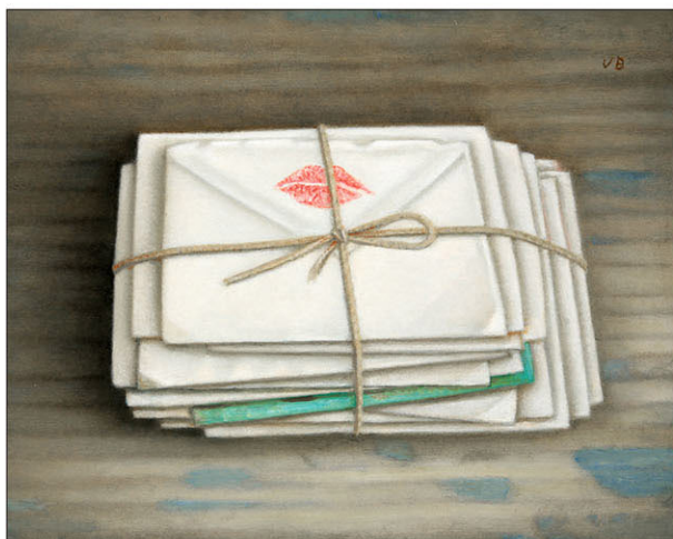
Anneke van Brussel" "Voorbije Liefde III" Past Love III olieverf/paneel 2022, 24 x 30 cm