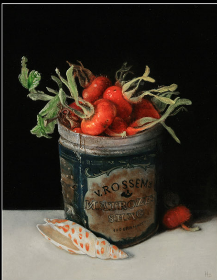
“Blik met Rozenbottels” 2021 olieverf/paneel 18,8 x 15 cm