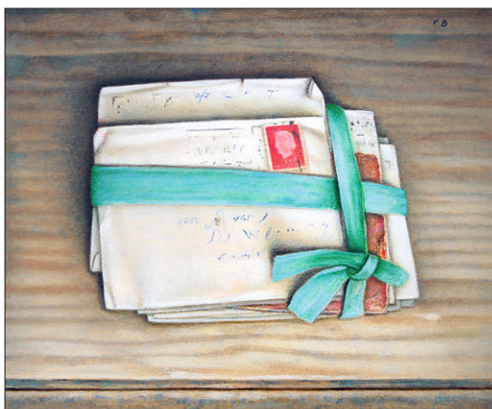
"Voorbije Liefde I" Past Love I 2022, olie/paneel, 24 x 30 cm