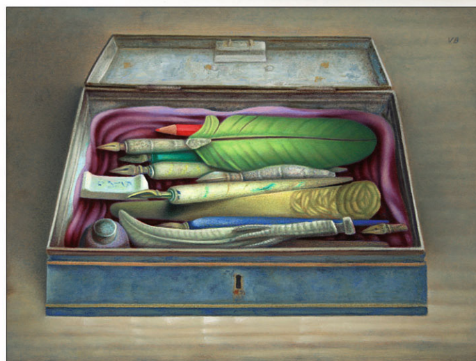
"Het Heilige Kistje" The Holy Box 2023, olieverf/paneel, 30 x 40 cm