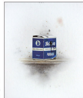
"Pieza 21 - Pelikan" 2017 kleurpotlood/karton 27 x 22 cm

Pas veel later ontdekte ik dat hij een van de leermeesters van Roa is geweest. Ook namen beiden deel aan internationale tentoonstellingen, o.a. in Japan en de VS. Sindsdien vraag ik mij af of ik het juist zie als ik stel dat Gustavo Isoe zich in Spanje ontworstelde aan de last van zijn eigen cultuur, en, vermoedelijk ongemerkt, Roa de handvaten aanreikte om boven zijn eigen nationale stijl- en beelddwang uit te stijgen. Overigens is Roa mij tijdens die ontdekkingsreis in Spanje ontgaan, maar gelukkig is dat later goedgekomen.