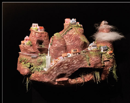
Johan Scherft "Toevluchtsoord II - Planetoïde" 2022 aquarel/papier - wolkje katoen, 8 x 11,5 x 5 cm

ingewikkelde automatonen, waarvan de kroon spant een minuscule carroussel van drie rollen tekeningen, die al draaiend een duizendtal verschillende combinaties van kop, lijf en staart te zien geven, u raadt het vermoedelijk al, van tal van prehistorische dieren. Omdat het draaimechanisme met de hand wordt bediend en men zodoende dagen bezig is om alle combinaties te zien, slaat pas dan het duizelingwekkende inzicht in de complexiteit van de schepping in volle kracht toe. U raadt het vast, dit is een ge-laagde zin. Met de geaquarelleerde vogeltjes, gemaakt van een blaadje papier, is iets dergelijks aan de hand, maar dat bewaar ik voor de volgende keer.